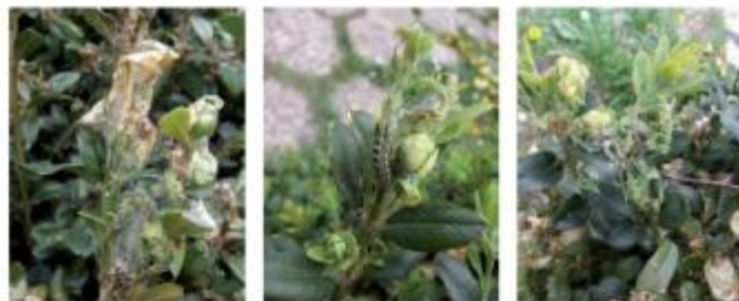
En haut et en bas à droite Pyrale du buis.