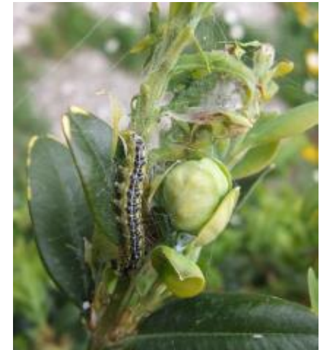
Pyrale du buis (M. JAVOY)