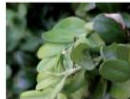
Pyrale du buis dégât à l'œuf.

Le buis attaqué est progressivement défeuillé sans qu'aucune feuille ne se retrouve au sol. Les vestiges de feuilles présents sur l'arbuste présentent des découpages dans aux chenilles. Les derniers stades larvaires sont assez gros pour être facilement visibles à l'œil nu.