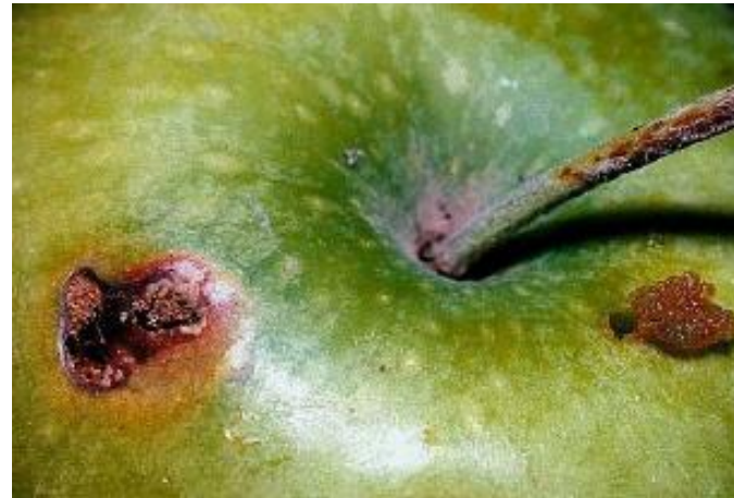
Carpocapse du pommier (INRA)