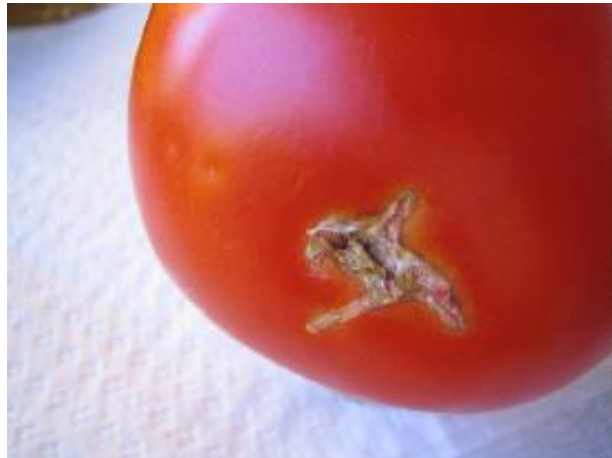
Tuta absoluta sur tomate (Russel, IPM)

www.ephytia.inra.fr onglet « Identifier les maladies et les ravageurs »